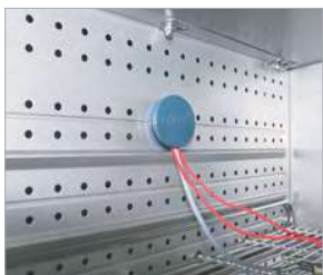
Foro di accesso con tappo in silicone

► Tutti gli extra online go2binder.com/it-opzioni