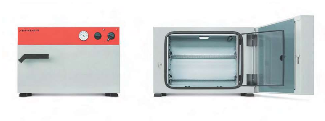
Modello B 28

L'incubatore della serie B si propone come apparecchio affidabile ed efficiente con una robusta attrezzatura a un prezzo interessante.