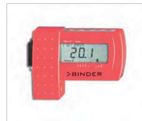
Data Logger per temperatura