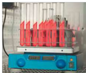
Esempio: agitatore nella camera